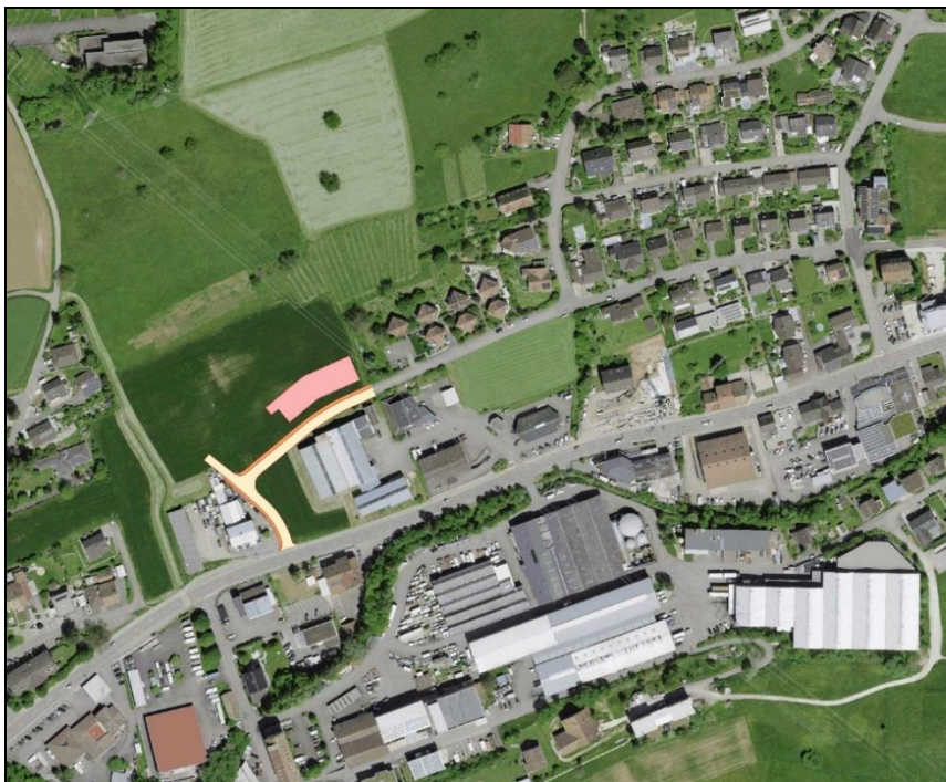
Bild 1: Projekt «Erweiterung Unterer Hofmattweg West, 2. Teilstück»

Der Baustart dieses Strassenneubaus ist im 1. Quartal 2024 geplant.